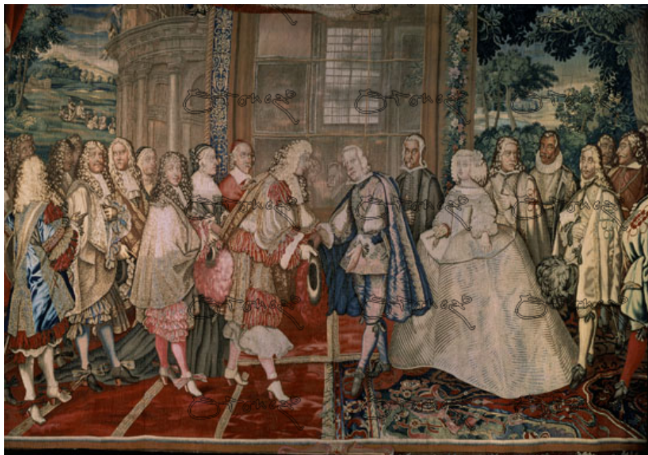
Tapiz francés que recoge el encuentro entre Luis XIV de Francia y Felipe IV de España, tras la firma de la Paz de los Pirineos

La guerra con Francia continuó hasta la Paz de los Pirineos (1659), firmada en la Isla de los Faisanes del Bidasoa en Irún, por la que se cedieron territorios en Flandes y al norte de Cataluña (como el Rosellón), además, el rey tuvo que aceptar que su hija, la infanta María Teresa, se desposara con el monarca francés Luis XIV, con la presencia del cardenal y ministro francés Mazarino y don Luis de Haro, por parte española, ambos artífices del tratado.